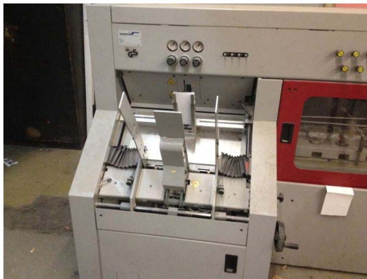
Slika 4. Ulagajući aparat

Tablica (1) prikaza grešaka na ulagaćem aparatu: