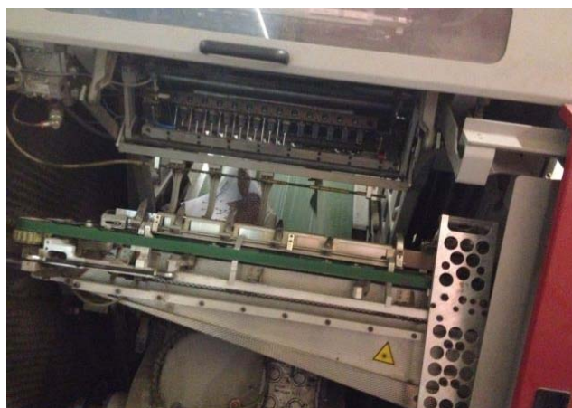
Slika 6. Centar za šivanje araka koncem

Nakon transportne trake dolazi se do najvažnijeg dijela stroja za šivanje, a to je centar za šivanje araka ili šivaće sedlo (slika 6.). Stroj za šivanje koncem Ventura se odlikuje patentiranom izradom omči pomoću raspuhujućeg zraka. To znatno skraćuje vrijeme pripreme stroja i time povisuje ekonomičnost proizvodnje. Konac biva od šivaće igle otpuhan prema kukičastoj igli. Omča koja se formira u kulisi biva zahvaćena kukičastom iglom i provučena kroz falc arka. Raspuhivači zraka su postavljeni lijevo i desno od šivaće igle i mogu pneumatski transportirati konac za tip šivanja cik-cak šivanje na lijevo ili desno. Na stroju Ventura se sva podešavanja koja se odnose na širinu rade preko motora za podešavanje (iznimka: magazin i slagač knjiga). Time se postiže skraćenje vremena pripreme i visoka preciznost podešavanja. Podacima upravlja Commander i mogu se po potrebi pozivati iz memorije. Za još veću učinkovitost bez praznog boda skrbi sustav za integrirano zavarivanje krajeva konca.