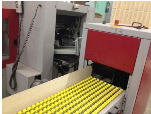
Slika 7. Izlagaća stanica

Izlagaća stanica (slika 7.) je zadnji dio stroja za šivanje koncem. Dolaze sašiveni knjižni blokovi, skidaju se sa stanice, slažu na paletu i sašiveni knjižni blokovi spremni su za daljnju doradu. Isto kao i na ulagaćem aparatu potrebno je podesiti širinu i dužinu arka i debljinu hrpta.