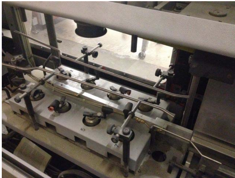
Slika 5. Transporter arka

Transporter arka (slika 5.) je jedinica poslije ulagaćeg aparata koja arak dovozi do centra za šivanje. Sa usisnicima agregata za otvaranje arci se po izboru mogu otvarati od 4 puta s prednje ili stražnje strane. Kod araka s repom naprijed ili repom nazad za otvaranje arka služi mač. Ovdje se može reducirati vakum, ovisno o debljini arka, kako se tanji arci ne bi poderali.