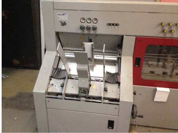
Slika 4. Ulagачi aparat

Tablica (1) prikaza grešaka na ulagaćem aparatu: