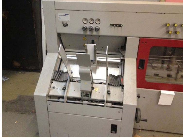
Slika 4. Ulagачi aparat

Tablica (1) prikaza grešaka na ulagaćem aparatu: