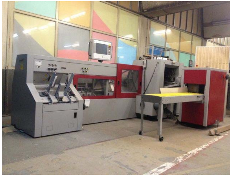
Slika 3. Stroj za šivanje knjižnih araka koncem - Ventura

Stroj za šivanje koncem Ventura (slika 3.) je pravi izbor za izradu kvalitetnih uspravno stojećih knjižnih blokova za meki i tvrdi uvez. On se odlikuje širokim formatnim područjem i mogućnošću dvostruke iskoristivosti. Sa strojem Ventura se mogu obrađivati najrazličitije vrste araka sa optimalnom brzinom i velikom kvalitetom šivanja.