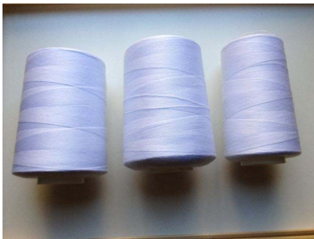
Slika 2. Sintetski konac za strojno šivanje knjiga