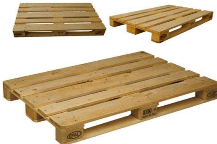
Slika 1. Paleta EUR (28)

Europske zemlje kojima pripada i Hrvatska, koriste ravne palete čije su dimenzije 1200x800 mm ili 1200x1000 mm. Viličar je najvažnije sredstvo za rad u procesu nastanka paleta. Viličar je transportno prijevozno i pretovarno sredstvo koje se podilazi ispod tereta, zatim ga diže ili spusti kako bi ga prebacio s jednog mjesta na drugo. Najčešće se koristi prilikom skladištenja, pretovara utovara ili istovara tereta (27).