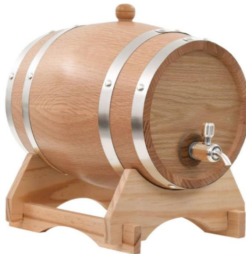
Slika 2. Drvena bačva (30)

Skoro svi proizvodi od drva imaju sličan zadatak, a to je izvršiti neku vrstu mehaničke funkcije. Ovdje se misli na upotrebu drva u proizvodnji ambalažnih materijala u koje spada i bačva. Bačva je jedinstvena vrsta proizvoda od drva koja svojom kemijskom strukturom izravno utječe na kvalitetu proizvoda kojega konzumiramo i tako mu podiže cijenu (29).