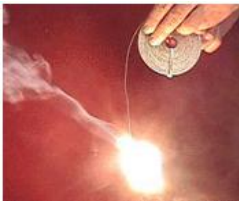
Slika 4. Magnezijeva vrpca

Magnezij je metal koji naglo izgara uz snažnu svjetlost. Koristi se od samih početaka speleološke fotografije. Koristio se u magnezijevim vrpca (slika 4) od kojih se otkidao komadić i potpaljivao šibicom na željenom mjestu.