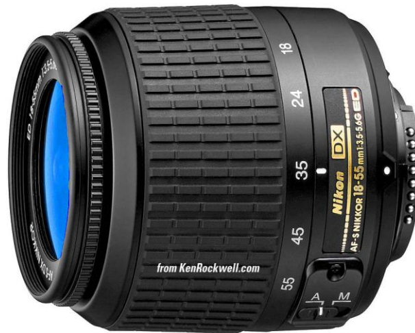
Slika 11. Nikon AF-S DX zoom objektiv 18-55mm f/3.5-5.6.