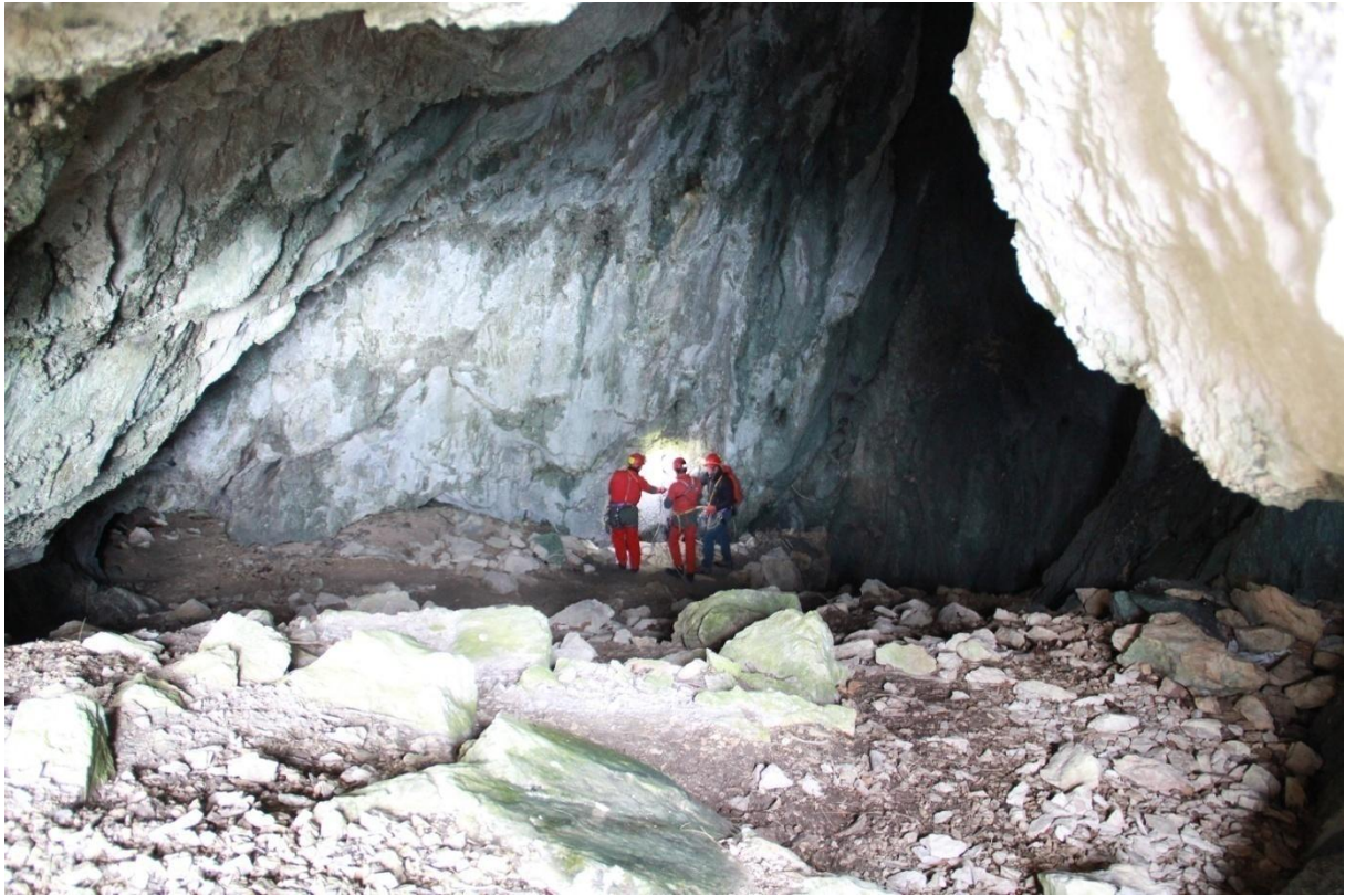
Slika 17. Špilja Krjava , 18.05.2014. , fotoaparar Canon EOS 550D

Fotografija je snimana bez dodatne rasvjete osim čeonih električnih lampi, 3 direktno i 2 indirektno osvjetljavaju scenu. Rađena je bez bljeskalice. Fotoaparar je stajao na stativu, a objektiv EF-S 18-135mm IS je otvora f/3,5 ; osjetljivost 1600 ISO; brzina eksponiranja 1/13 s. Čitav prostor (osim sjene ) je prilično dobro osvjetljen a objekti uočljivi.