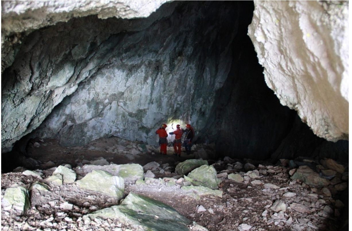
Slika 19. Špilja Krjava, 18.05.2014. , fotoapararat Canon EOS 550D

Fotografija je snimana na isti način kao i prethodne, sa istom opremom, istom rasvjetom, i istim otvorom objektiva, i istom vrijednošću za osjetljivost, ali ovaj puta sa još manjom brzinom eksponiranja f/30 s. Primjećuje se da je fotografija još tamnija od prethodne . Detalji su još uvijek prilično uočljivi.