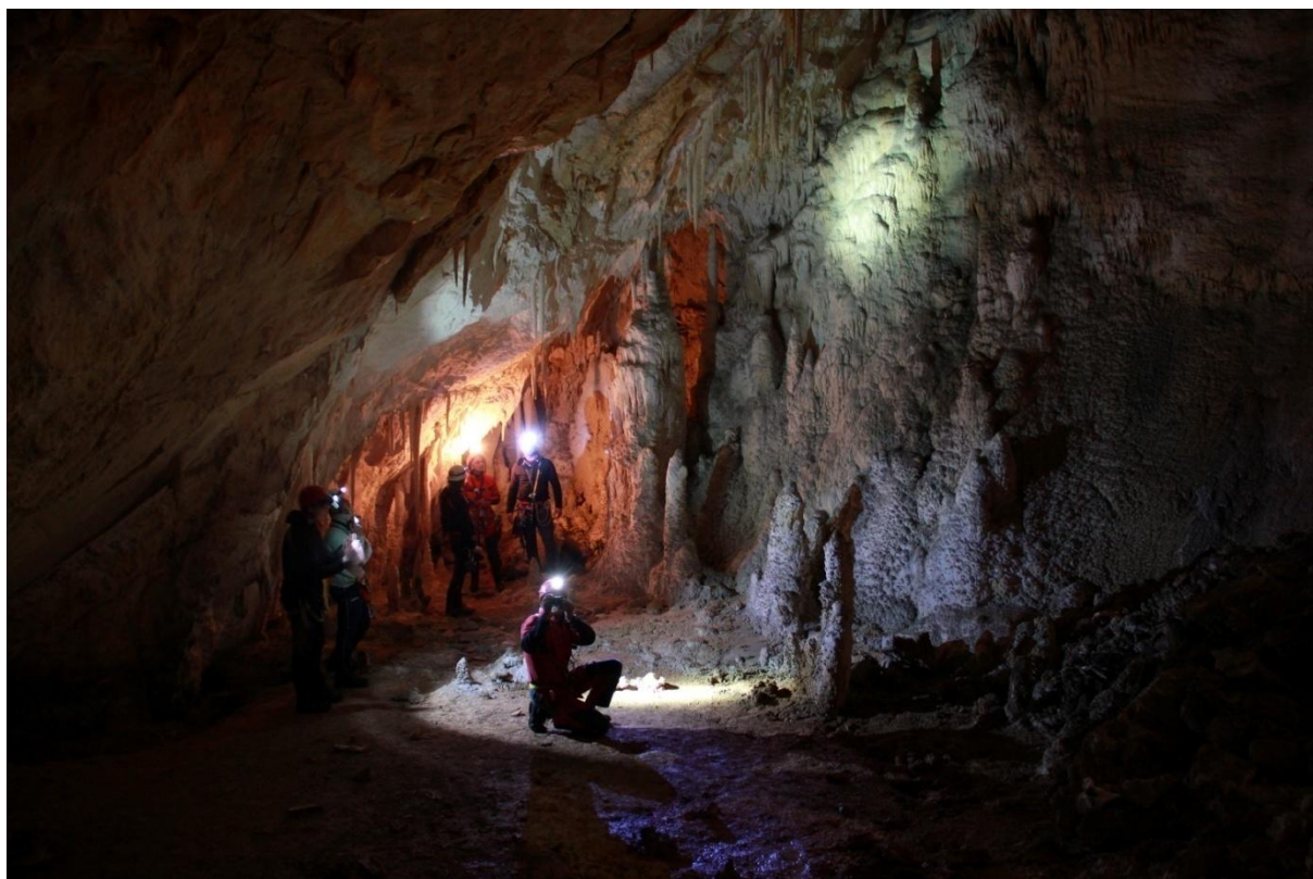
Slika 21. Špilja Krjava, 18.05.2014. , fotoaparat Canon EOS 550D

Fotografija je snimana bez dodatne rasvjete osim 5 čeonih električnih lampi, jedne ručne električne lampe i jedne karbidne (crvenkasto svijetlo). Rađena je bez bljeskalice. Fotoaparat je stajao na stativu, a objektiv EF-S 18-135mm IS je otvora f/3,5 ; osjetljivost 1600 ISO; brzina eksponiranja 1/30 s. Primjećujemo kako je svjetlost koju daje karbidna lampa prilično raspršena, za razliku od električnih lampi koje daju usmjeren snop svijetla.