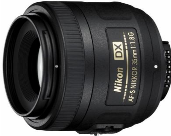
Slika 10. Fiksni objektiv AF-S DX NIKKOR 35mm f/1,8g

Od fiksnih objektivu u speleologiji se uglavnom koriste širokokutni objektivu i normalni, a rjeđe makro objektivu.