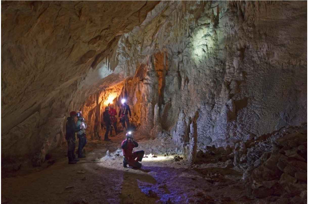
Slika 22. Špilja Krjava, 18.05.2014. , fotoaparat Canon EOS 550D

Ovo je prethodna fotografija (slika 21) obrađene u Photoshopu , osvijetljena i tonirana, gdje se vide mogućnosti naknadne obrade fotografija sa raznim alatima za obradu fotografija. Osim što je pećina znatno bolje osvijetljena, i svi detalji i objekti su znatno uočljiviji. Rasvijetljena su tamna mjesta u sjeni, koja su na prethodnoj fotografiji teško uočljiva.