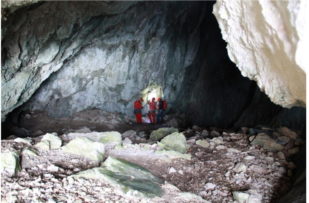
Slika 18. Špilja Krjava, 18.05.2014. , fotoapararat Canon EOS 550D

Fotografija je snimana na isti način kao i gornja, sa istom opremom, i istom rasvjetom, istim otvorom objektiva i iste vrijednosti za osjetljivost. Jedina je razlika u brzini eksponiranja, ovdje je nešto kraća i iznosi 1/20 s. Vidimo da je fotografija za nijansu tamnija od gornje, ali objekti su još uvijek prilično osvijetljeni i uočljivi.