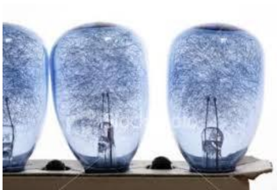
Slika 6. Magnezijeve žaruljice za bljeskalicu

Električna bljeskalica je bila u širokoj upotrebi 1950-tih i 1960-tih godina a zatim ih je potisnula elektronska bljeskalica. Magnezij je smješten u žaruljicu u obliku finih niti i okružen kisikom pod određenim tlakom (slika 6). Ove okolnosti određuju trenutačno kontrolirano izgaranje magnezija. Izvana je žaruljica prekrivena slojem prozirne elastične celuloze koji zadržava krhotine stakla nakon izgaranja. [1] Postoje magnezijeve bljeskalice čak jače od elektronske, ali se svjetlo usmjerava samo u uskom snopu prema objektu. Temperatura boja im je od 3800°K do 5500°K. Brojka vodilja između 35 i 160.