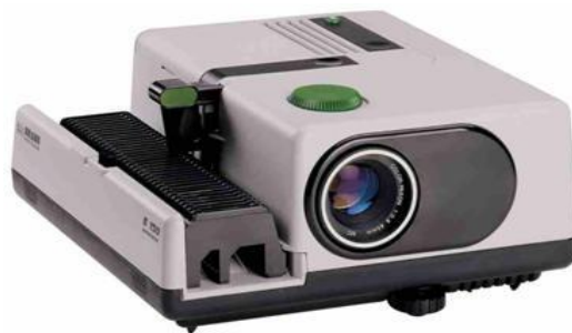
Slika 12. Dijaprojektor VEGAMAT 150AF sa dijafilmom

Film je jedan od najvažnijih izuma u fotografiji koji je omogućio jednostavno zapisivanje svjetla na medij. Filmovi su zapravo prozirne plastične (celuloidne) vrpce koje na sebi imaju tanke premaze kemikalija koje su osjetljive na svjetlo. Zato nerazvijeni film ne smijemo izlagati svjetlu jer ga uništiti. Film koji se nalazi u posebnoj zatvorenoj kutijici ulaže se u klasični fotoaparat i zatim se zatvara kako se ne bi osvijetlio. Kad se pritisne okidač na aparatu, film se kratko osvjetljava i zatim se mora pomaknuti navijanjem kako bi se kodnarednog okidanja aparata osvijetlio sljedeći dio filma. U jednoj kutijici najčešće ima filmaza 36 ekspozicija, što znači da se jednim filmom može dobiti 36 negativa (ili pozitiva, ako je film pozitiv) i 36 fotografija. Kad se film „ispuca“ u fotoaparatu se premota u svoju kutijicu i s tom kutijicom ide na razvijanje u tamnu komoru, gdje se razvijanjem dobiva negativ (suprotnih boja od onih u prirodi). Od negativa daljnjim prenošenjem na foto papir dobiva se fotografija . [9]