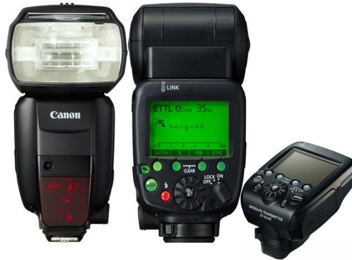
Slika 7. Canon vanjska bljeskalica 600EX-RT sa radio odašiljačem ST-E3-RT

snimanju u vrlo kratkom vremenu. Bljeskalica se pokazala kao jedan od najkorisnijih izvora svjetla u fotografiji. Razloga je nekoliko, prije svega to su stalnost temperature boje i količine svjetla kroz cijeli životni vijek rasvjetnog tijela.