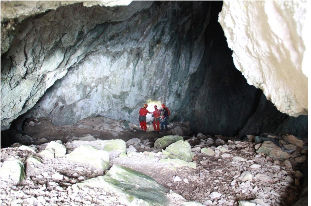
Slika 17. Špilja Krjava , 18.05.2014. , fotoaparar Canon EOS 550D

Fotografija je snimana bez dodatne rasvjete osim čeonih električnih lampi, 3 direktno i 2 indirektno osvjetljavaju scenu. Rađena je bez bljeskalice. Fotoaparar je stajao na stativu, a objektiv EF-S 18-135mm IS je otvora f/3,5 ; osjetljivost 1600 ISO; brzina eksponiranja 1/13 s. Čitav prostor (osim sjene ) je prilično dobro osvjetljen a objekti uočljivi.