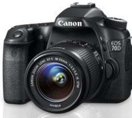
Slika 9. Canon 70D DSLR fotografski aparat sa EF-S 18-55mm objektiv

Kod refleksnih fotoaparata slika koja se vidi u tražilicu je ista ona koja pada na film (čip), dok je kod kompaktnih malo pomaknuta, što je prednost za snimanje iz veće blizine. Većina imaju mogućnost kompenziranja ekspozicije, a neki čak i dugih: 1/8', 1/4', 1/2', 1', 2', 4', pa čak i duže. Neki od njih načinjeni su od materijala za grubu terensku upotrebu, te imaju na raspolaganju različit pribor (razne vrste objektiv, prstenove za snimanje iz blizine ....). Prilično su skupi.