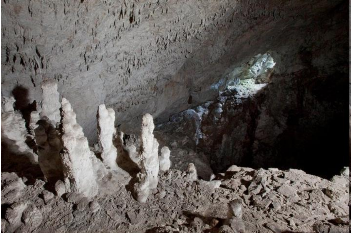
Slika 24. Jama za Piščetom, 20.02. 2011., fotoaparata Canon EOS 5D Mark II

Fotografija je rađena fotoaparatom Canon EOS 5D Mark II i objektivom EF-S 18-135mm sa postavkama B brzine ekspozicije (beskonačno). Rasvjeta je kombinirana, osim vanjske bljeskalica i čeonih karbidnih lampi, imamo i prodor dnevnog svjetla na ulazu u špilju sa desne strane.