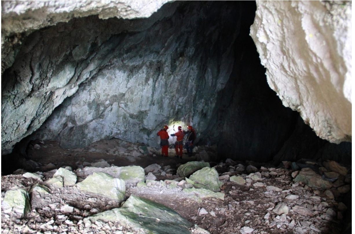
Slika 19. Špilja Krjava, 18.05.2014. , fotoaparar Canon EOS 550D

Fotografija je snimana na isti način kao i prethodne, sa istom opremom, istom rasvjetom, i istim otvorom objektiva, i istom vrijednošću za osjetljivost, ali ovaj puta sa još manjom brzinom eksponiranja f/30 s. Primjećuje se da je fotografija još tamnija od prethodne . Detalji su još uvijek prilično uočljivi.