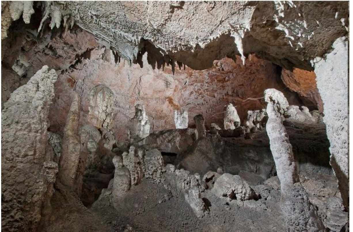
Slika 23. Jama za Piščetom, 20.02. 2011., fotoaparata Canon EOS 5D Mark II

Fotografija je rađena fotoaparatom Canon EOS 5D Mark II i objektivom EF-S 18-135mm sa postavkama B brzine ekspozicije (beskonačno). Rasvjeta je kombinirana - vanjska bljeskalica i tri čeone karbidne lampe. Fotografija je dobro osvijetljena i svi detalji vidljivi.