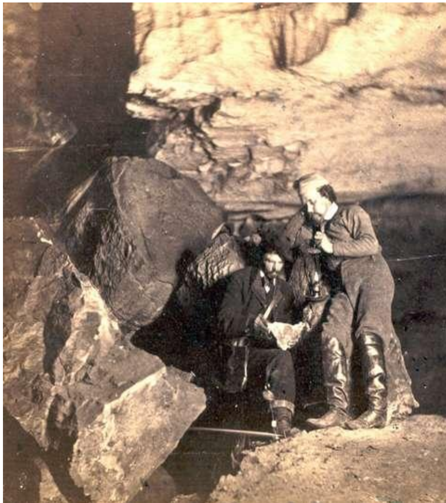
Slika 2. Charles Waldack Beyond the "Bridge of Sighs" , 1866 [Mammoth Cave Views]

Iako skup, magnezij je bio jedini izvor svjetla za rad pod zemljom. Godine 1866.belgijski imigrant Charles Waldack (1831-1882) pri fotografiranju u špilji Mammoth Cave, Kentucky (slika 2), koristi 120 magnezijevih svijeća i stvara 80 negativa. Četrdeset od njih su označene i odobrene kao stereo view. Waldack razvija tehnike i načela u podzemnoj fotografiji koji ostaju vodeći i danas.Rasvjeta mora biti postavljena sa strane fotoaparata, nikako u smjeru optičke osi. Koristio je širokokutni fotografski aparat montiran na stativ, čime je riješio pomicanje aparata za duge ekspozicije. [8]