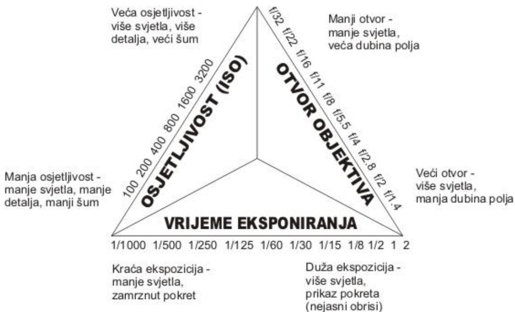
Ilustracija 1. Ekspozicijski trokut (rađeno u CorelDRAW13) [10]

Kako je fotografiranje u špiljama jako zahtjevan posao, za dobru speleološku fotografiju osim opreme, treba i dosta iskustva i vježbanja. Odabir fotoaparata je jako važna stvar pri snimanju. Klasični fotoaparat je loš u špiljskim uvjetima gdje nema dovoljno rasvjete, a u maglovitom ili prašnjavom ambijentu je neupotrebljiv. Ipak, u makrofotografiji može jako pomoći. Digitalni fotoaparati sasvim dobro reagiraju na sinkronizaciju bljeskalice (dva predbljeska, bljesak, post bljesak - ovisno o modelu i kvaliteti). Dobro je imati digitalni fotoaparat kojemu je podesiva ekspozicija bljeskalice. Nabaviti bljeskalicu koja može biti u TTL digitalnoj vezi. Neke od tih bljeskalica imaju ugrađene foto ćelije za daljinsko okidanje, pa ne treba posebna foto ćelija. Za kreativniju fotografiju potrebno je često koristiti fotoaparat u ručnom načinu rada, što omogućava podešavanje vremena eksponiranja, otvora objektiva i osjetljivosti. Osjetljivost se obično koristi u rasponu od 100 do 400 ISO jedinica (manja osjetljivost manji šum, veća osjetljivost veći šum). O vremenu eksponiranja ovisi količina svjetla na fotografiji (duže vrijeme – više svjetla 1/30s; kraće vrijeme – manje svjetla 1/400 s) i mogućnost hvatanja pokreta. O otvoru objektiva ovisi prikaz dubine polja.[4]