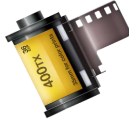
Slika 13. 35 mm kolor film

Film može biti i dijapozitiv (tada je razvijen i fiksiran u pravim bojama) a takav se koristi za gledanje preko dijaprojektora na projekcijskom platnu, pa ga zovemo dijafilm, i od njega ne možemo razvijati fotografije (slika 12.).[1]