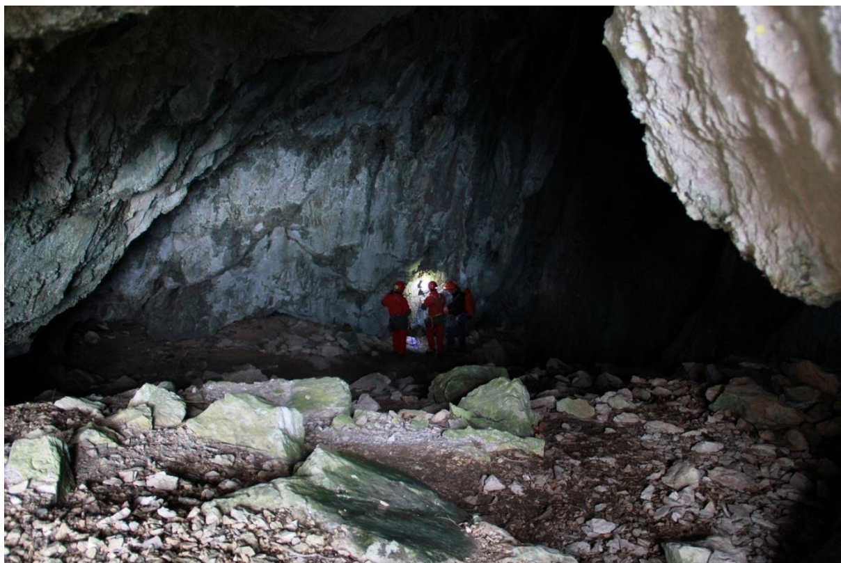
Slika 20. Špilja Krjava, 18.05.2014. , fotoaparat Canon EOS 550D

I ova fotografija je snimana na isti način kao i prethodne, sa istom opremom, istom rasvjetom, i istim otvorom objektiva, ali ovdje je osjetljivost smanjena na 800 ISO, a brzina eksponiranja 1/30 s. Fotografija je prilično tamna, ali za razliku od prethodnih ima manje šuma. Dubina polja je i ovdje prilično dobra, kao i na prethodnim fotografijama. Smanjivanjem otvora objektiva dobila bi se veća dubina polja, ali na štetu rasvjete, koja se ovdje ne može žrtvovati zbog nedostataka dodatnih izvora svjetla.