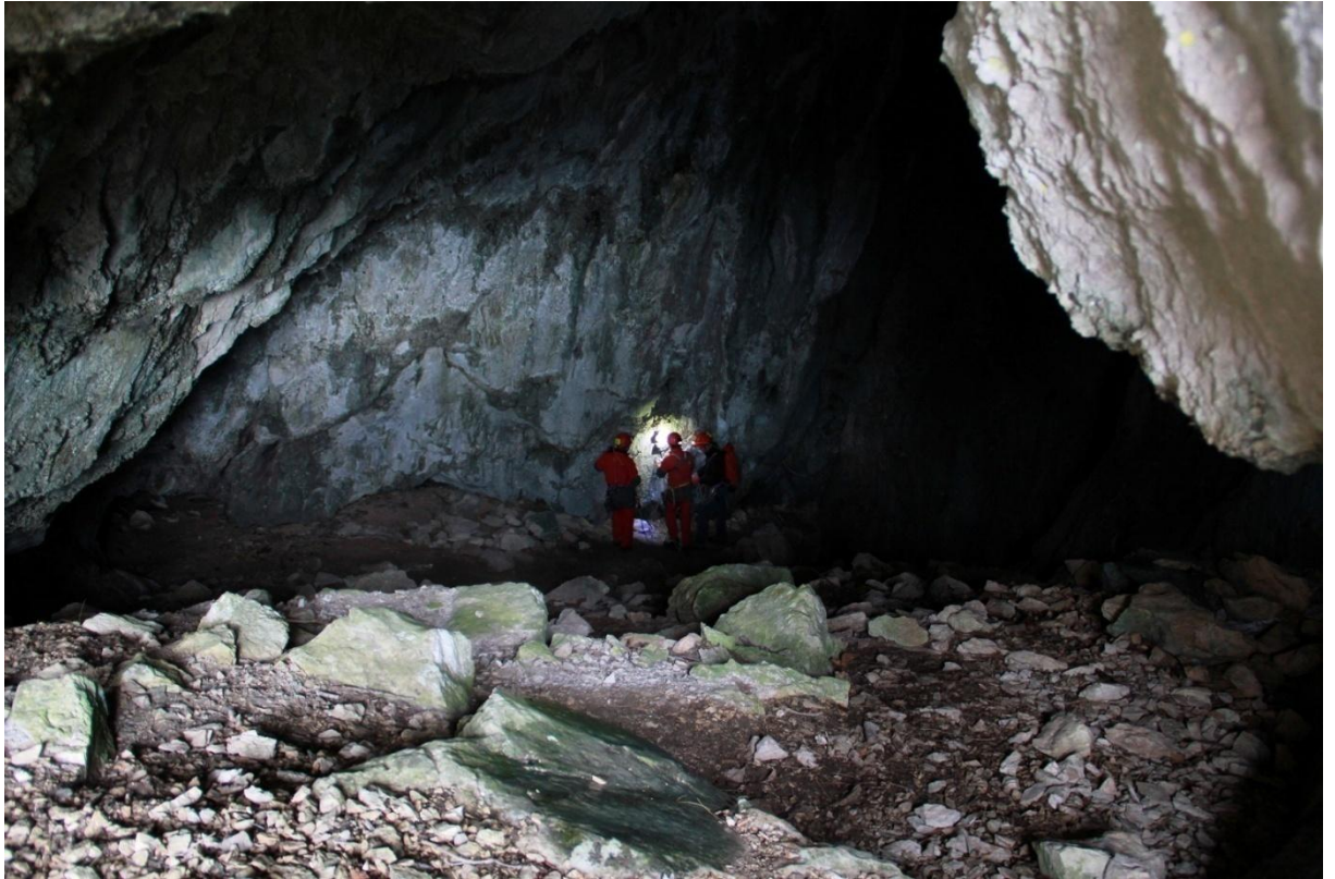
Slika 20. Špilja Krjava, 18.05.2014. , fotoaparat Canon EOS 550D

I ova fotografija je snimana na isti način kao i prethodne, sa istom opremom, istom rasvjetom, i istim otvorom objektiva, ali ovdje je osjetljivost smanjena na 800 ISO, a brzina eksponiranja 1/30 s. Fotografija je prilično tamna, ali za razliku od prethodnih ima manje šuma. Dubina polja je i ovdje prilično dobra, kao i na prethodnim fotografijama. Smanjivanjem otvora objektiva dobila bi se veća dubina polja, ali na štetu rasvjete, koja se ovdje ne može žrtvovati zbog nedostataka dodatnih izvora svjetla.