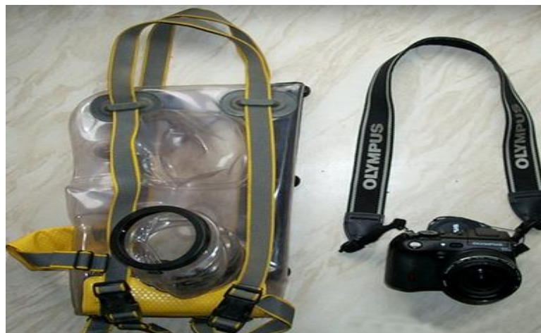
Slika 8. Olympus C8080WZ CCD (kompaktni) fotografski aparat

Kompaktni fotoaparati su manji, praktičniji i jednostavniji. Sastoje se od manjeg tijela koje je najčešće veličine šake (slika 8). Imaju jedan objektiv promjenjive žarišne duljine, tzv. zoom objektiv i najčešće ugrađenu bljeskalicu. Njima se fotografira tako da se na LCD zaslonu (koji je na stražnjoj strani aparata) odredi kadar i jednostavnim pritiskom na okidač (najčešće na vrhu aparata) snimi fotografija. Ovakvi fotoaparati uglavnom nemaju optičko tražilo. Ako ga i imaju njime se ne gleda kroz objektiv, već kroz poseban prozorčić. Imaju ograničene mogućnosti za kreativno snimanje, no neki od njih ipak nude neke mogućnosti kontroliranja bljeskalice, određivanje modusa snimanja (makro, sport, pejzaž, portret, noćno snimanje) te podešavanja svjetline fotografija. Prvenstveno su napravljeni za snimanje u automatskom režimu. Fotoaparati bez mogućnosti ručnog podešavanja nazivaju se „point and shoot camera“. [9]