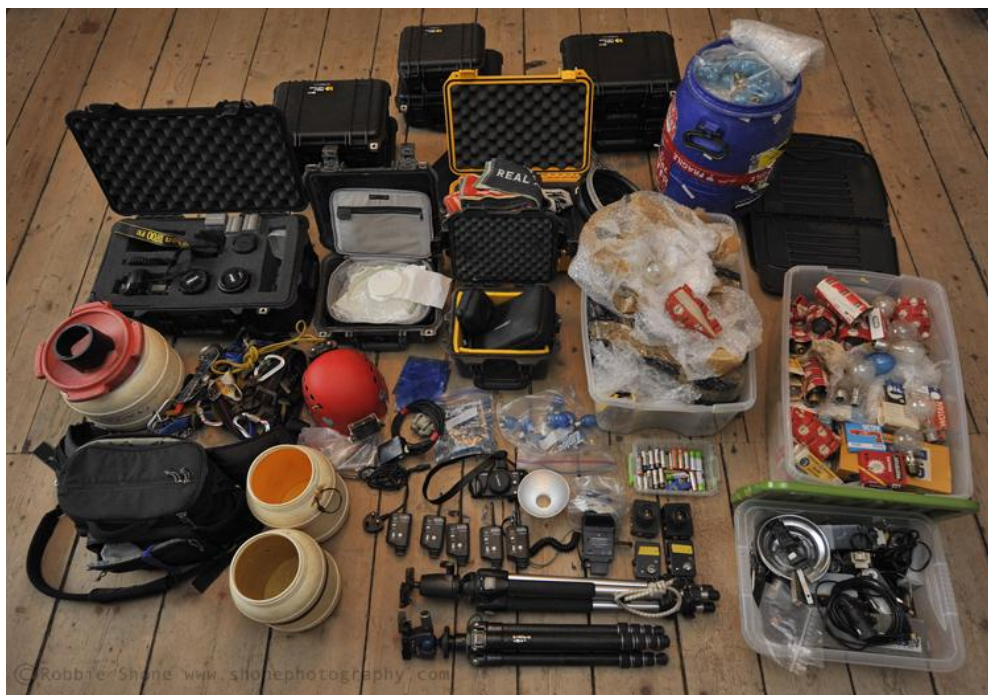
Slika 14. Oprema za fotografiranje u špiljama

Za uvjete u špiljama važno je da stalak bude čvrst i otporan, ali ne smije biti velik i težak, zbog mnoge ostale opreme koju speleolog nosi. Fotoaparati se pričvršćuju na postolje na vrhu stalka, na kojem se nalazi mehanizam za namještanje fotoaparata u željeni položaj. Tri noge su sklopive s mogućnošću preciznog namještanja visine za svaku nogu posebno, što je jako bitno za neravno tlo.[1]