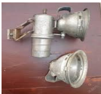
Slika 3. Karbidna lampa