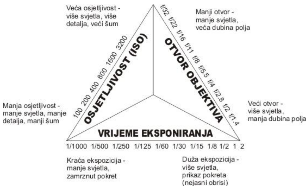
Ilustracija 1. Ekspozicijski trokut (rađeno u CorelDRAW13) [10]

Kako je fotografiranje u špiljama jako zahtjevan posao, za dobru speleološku fotografiju osim opreme, treba i dosta iskustva i vježbanja. Odabir fotoaparata je jako važna stvar pri snimanju. Klasični fotoaparat je loš u špiljskim uvjetima gdje nema dovoljno rasvjete, a u maglovitom ili prašnjavom ambijentu je neupotrebljiv. Ipak, u makrofotografiji može jako pomoći. Digitalni foto aparati sasvim dobro reagiraju na sinkronizaciju bljeskalice (dva predbljeska, bljesak, post bljesak - ovisno o modelu i kvaliteti). Dobro je imati digitalni fotoaparat kojemu je podesiva ekspozicija bljeskalice. Nabaviti bljeskalicu koja može biti u TTL digitalnoj vezi. Neke od tih bljeskalica imaju ugrađene foto ćelije za daljinsko okidanje, pa ne treba posebna foto ćelija. Za kreativniju fotografiju potrebno je često koristiti fotoaparat u ručnom načinu rada, što omogućava podešavanje vremena eksponiranja, otvora objektiva i osjetljivosti. Osjetljivost se obično koristi u rasponu od 100 do 400 ISO jedinica (manja osjetljivost manji šum, veća osjetljivost veći šum). O vremenu eksponiranja ovisi količina svjetla na fotografiji (duže vrijeme – više svjetla 1/30s; kraće vrijeme – manje svjetla 1/400 s) i mogućnost hvatanja pokreta. O otvoru objektiva ovisi prikaz dubine polja.[4]