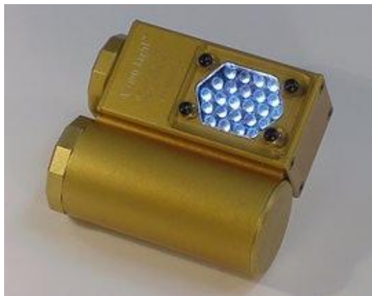
Slika 5. Čeona električna rasvjeta

Električna rasvjeta se sastoji od izvora struje i odgovarajućih žarulja (slika 5) ili reflektora. U turistički uređenim špiljama već postoji takva rasvjeta. Izvor struje može biti generator, ali se uglavnom koriste akumulatori jer su povoljniji i lakši za transport. Ponekad se za fotografiranje koristi i ručna baterijska svjetiljka, pogotovo ako je jakog inteziteta. [1]