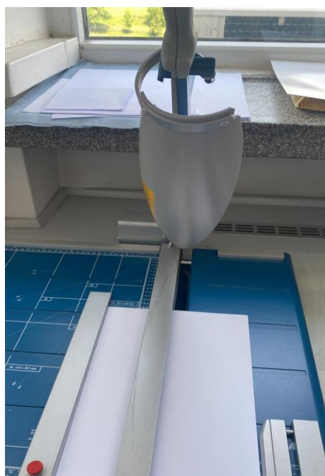
Slika 7: Giljotina

Giljotina je uređaj za rezanje papira čija je gornja i donja oštrica od brušenog kvalitetnog čelika. Ima prednji stol s graničnikom i laserski modul. Vrhunska sigurnost je zajamčena rotacijskim štitnikom. Posjeduje vodilice s oznakama u centimetrima i inchima.