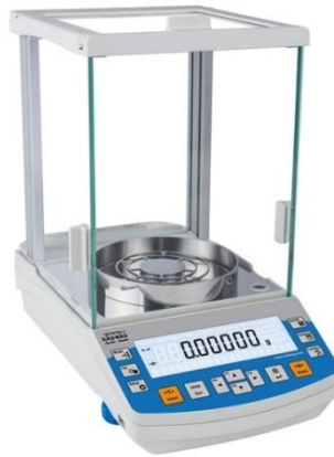
Slika 8: Analitička vaga

Analitička vaga je uređaj koji garantira pouzdanost i točnost mjerenja s preciznošću od 0,0001 g. Sadrži komoru za vaganje gdje se odlažu predmeti koji će se vagati. Ima i LCD ekran koji omogućava jasan prikaz rezultata mjerenja.