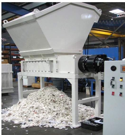
Slika 3: Uređaj za usitnjavanje papira

Nakon što je sortiranje završeno, sljedeći korak uključuje usitnjavanje nakon čega slijedi pulpiranje. Usitnjavanje se vrši kako bi se papirni materijal razbio na male komadiće. Nakon što je materijal fino usitnjen na komadiće, miješa se s vodom i kemikalijama za razgradnju materijala od papirnih vlakana. Razvlaknjivanje je proces koji pretvara papirnate materijale u kašu. Ovo je točka gdje se podvrgava procesu zagrijavanja koji ga pretvara u pulpu, što se postiže dodavanjem vode i kemikalija kao što su kaustična soda i vodikov peroksid [3].