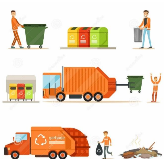
Slika 1: Prikupljanje i transport otpada