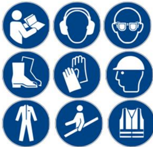
Slika 7. – Znakovi obaveza