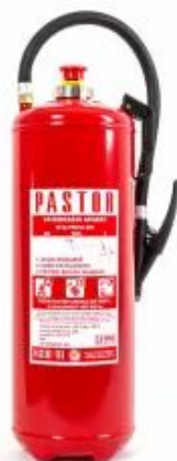
Slika 9. – Aparat za gašenje požara