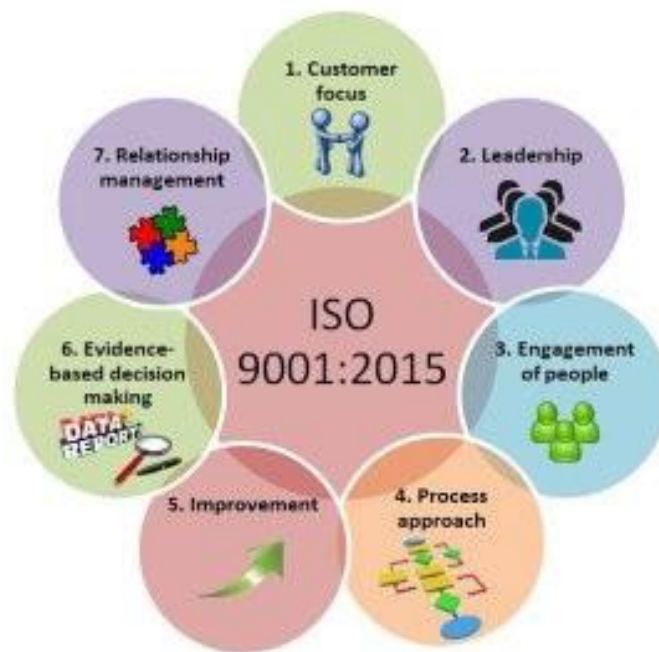
Slika 14. – 7 načela za poboljšanje organizacijskog poslovanja