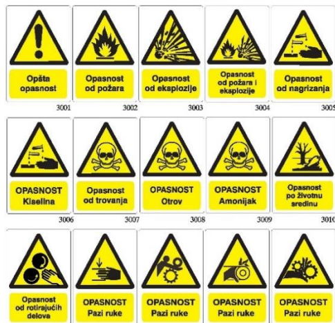
Slika 8. – Znakovi opasnosti