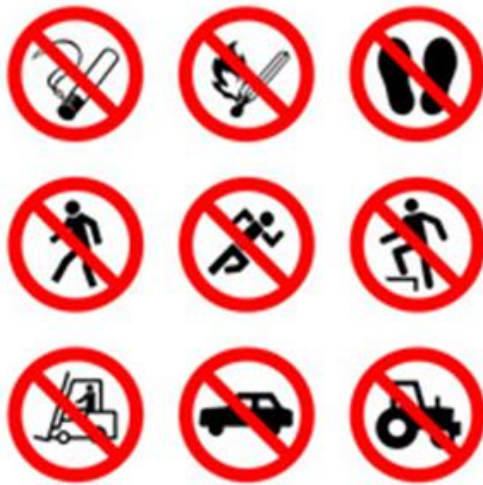
Slika 6. – Znakovi zabrane