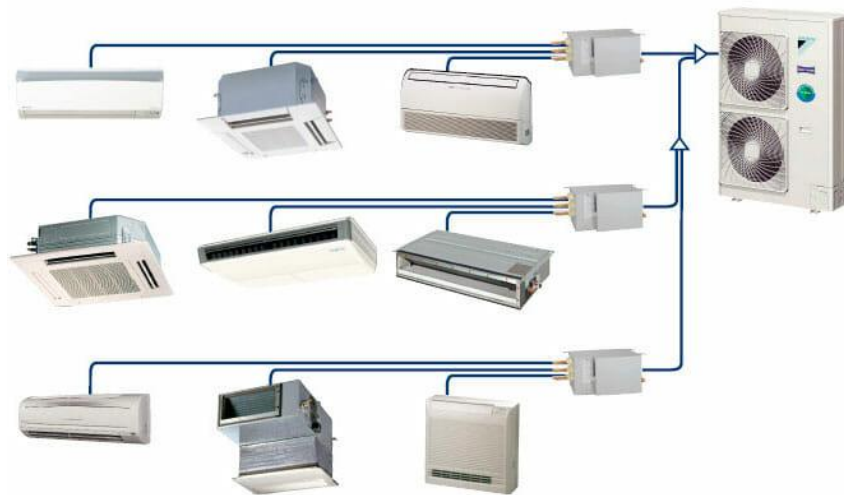
Slika 1. – Sustav uređaja za klimatizaciju skladišnog prostora ( Izvor: https://www.klimakoncept.hr/hr/podrska-klimatizacija-sve_o_klimatizaciji_stambenog_i_poslovnog_prostora/1425/135 )

ili materijala zahtijevaju određenu temperaturu kako bi davali što kvalitetnije rezultate. Temperatura skladišnog prostora grafičkog poduzeća ovisi o atmosferi i vanjskoj temperaturi, a o tome koja je vrsta skladišta i koliku izolaciju skladište ima ovisi količina vanjskog utjecaja na prostor unutar skladišta. Temperaturu u skladišnom prostoru grafičkog poduzeća možemo mjeriti termometrom, a tada temperaturu možemo regulirati rashladnim uređajima, tj. klimama ako je potrebno spustiti temperaturu ili grijalicama ako je potrebno podići temperaturu unutar skladišnog prostora grafičkog poduzeća. Slika 1. prikazuje primjer sustava uređaja za klimatizaciju skladišnog prostora grafičkog poduzeća.