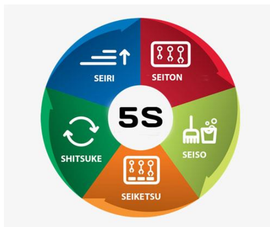
Slika 12. – Faze 5s metode