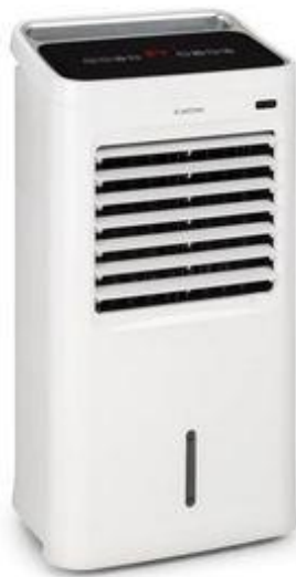
Slika 2. – Uređaj za povećanje vlage skladišnog prostora