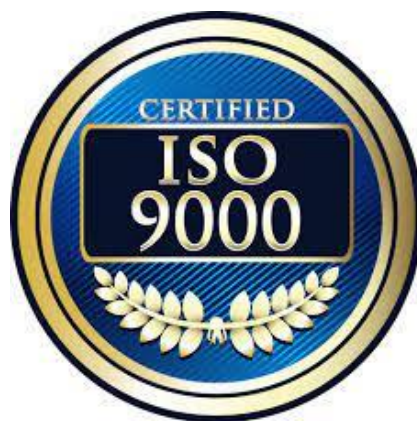
Slika 13. – ISO 9000 oznaka posjedovanje certifikata

Proces certificiranja razlikuje se ovisno o standardu i certifikacijskom tijelu. Koliko će cijeli proces trajati ovisi o veličini tvrtke ili organizacije, o broju zaposlenih i o tome da li tvrtka ili organizacija otprije prakticira upravljanje kvalitetom. Prednosti koje se ostvaruju primjenom ovog standarda i dobivanjem certifikata su bolja kvaliteta proizvoda i usluge, veće zadovoljstvo i povjerenje kupaca, veća produktivnost, smanjenje troškova i bolje konkuriranje na tržištu.