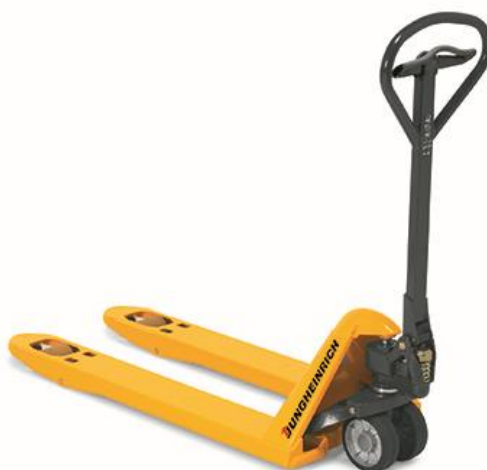
Slika 4. – Ručni viličar

Postoje razna transportna sredstva koja se koriste unutar skladišnih prostora grafičkog poduzeća. Ona su obavezna za skladišni prostor kako bi se roba koja se tamo nalazi mogla što brže i sa što manje napora transportirati unutar skladišta. Neka od tih transportnih sredstava su transportna kolica, ručni viličar (slika 4.), mehanički viličar, skejt (daska na 4 kotača koja služi za lakše pomicanje robe) i postoje još mnoga druga. [7]