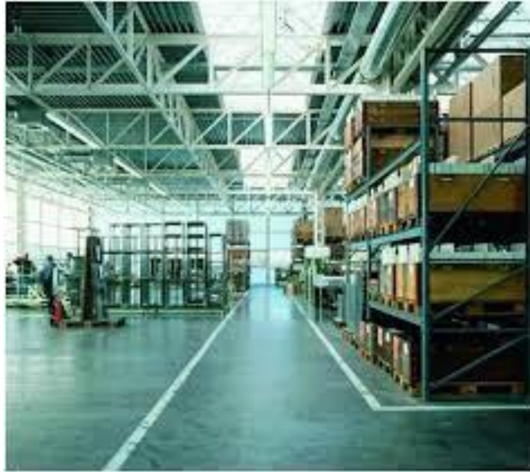
Slika 5. – Označena površina za transportna sredstva