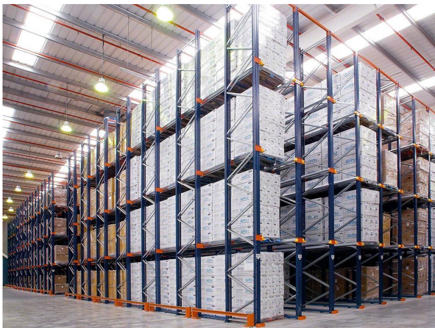
Slika 3. – Sustav regala s prolazom unutar skladišnog prostora